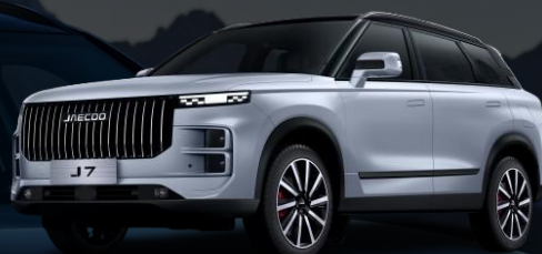
MOONLIGHT SREBRNA + ČRNA STREHA (800.00 €)