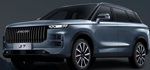
OLIVE SIVA (brezplačna)