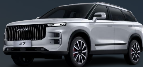
PEARL BELA (500.00 €)