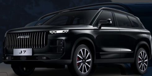
CARBON CRYSTAL ČRNA (500.00 €)